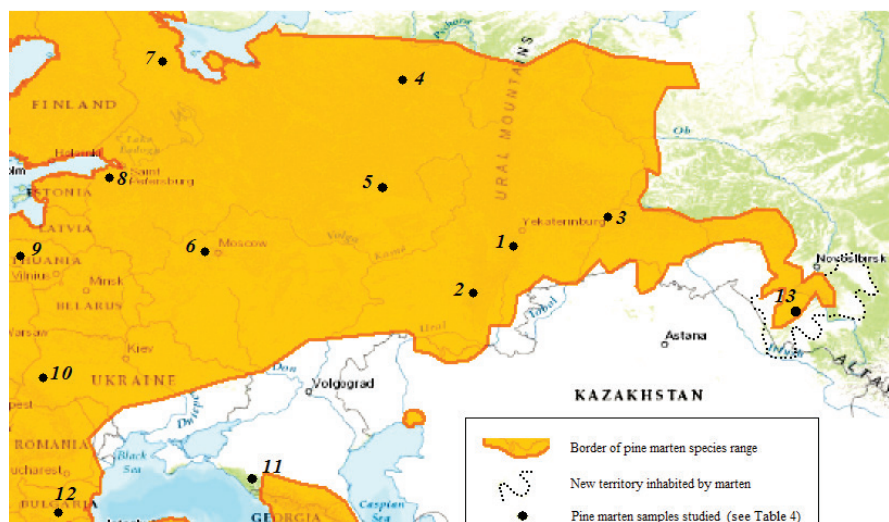
Рис. 1. Изученный район (точка 13) на карте восточной части ареала Martes martes (фрагмент из: Herrero et al. [6]). Нумерация локалитетов, как в табл. 4.

Для оценки морфологического статуса лесной куницы Алтайского края необходимо наличие морфометрических данных по основным параметрам, принятым в классической зоологии (см. табл. 1, 2). Эти сведения получены нами путём измерений животных из промысловых выборок 2016–2019 гг. Основные метрические экстерьерные показатели 20 изученных животных (сборы 2018–2019 гг.) приведены в табл. 1.