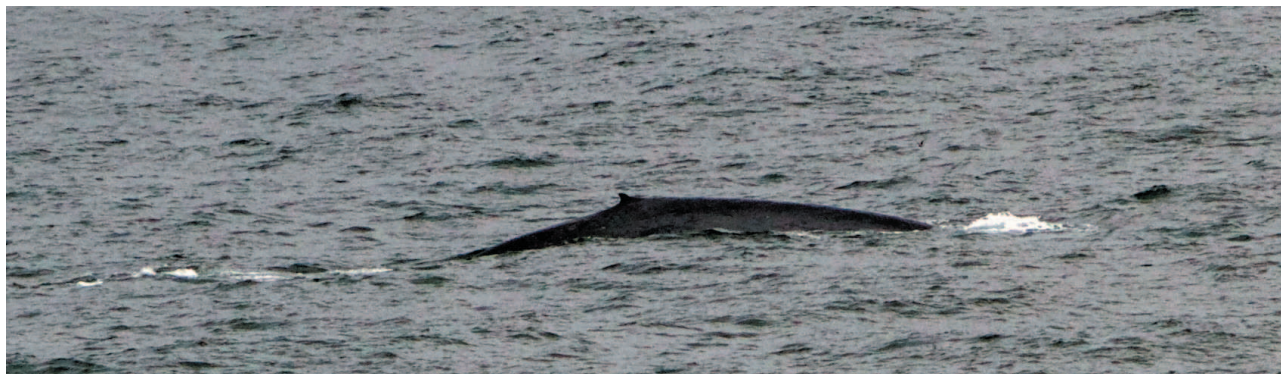
Рис. 2. Синий кит Fig. 2. Blue whale