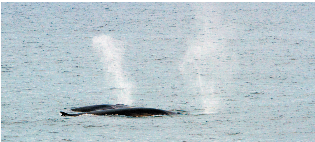
Рис. 4. Финвал Fig. 4. Fin whale