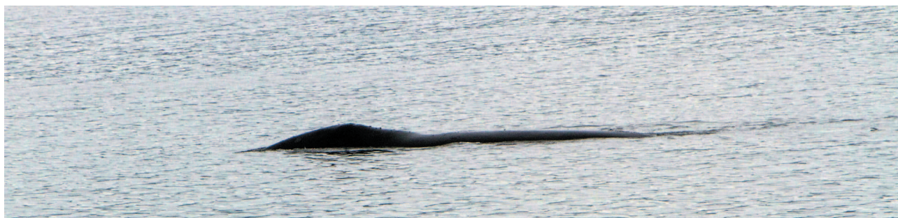
Рис. 5. Гренландский кит Fig. 5. Bowhead whale

По внешним признакам и поведению косаток, животные, встреченные у севера Сахалина (оди-