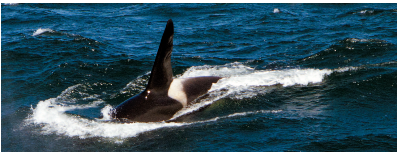
Рис. 6. Косатка Fig. 6. Killer whale