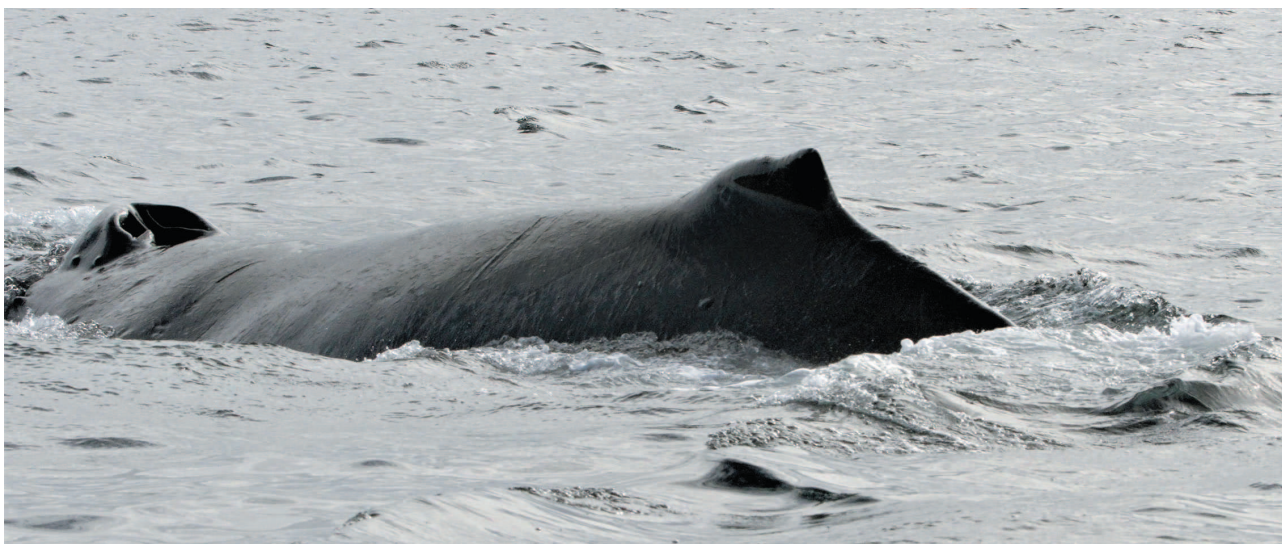
Рис. 3. Горбатый кит Fig. 3. Humpback whale

Финвал ( Balaenoptera physalus ) . Во время рейса зарегистрировано шесть встреч 11 особей финвалов (рис. 4), однако при одной из встреч возле Командорских островов вид определен не точно (возможно, это был сейвал). Все они были встречены на участке г. Петропавловск-Камчатский – Командорские острова, где финвалы перемещались преимущественно в северном направлении вместе с другими видами китообразных (синие киты, горбатые киты (рис. 1)).