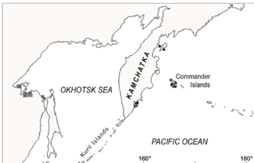
Рис. 1. Места сбора генетического материала. Точки взятия проб от плотоядных косаток обозначены квадратами, от рыбоядных — треугольниками.

Fig. 1. Places of collection of genetic material. The points of taking of samples from carnivore killer whales are marked with squares, from the piscivorous ones — triangles.