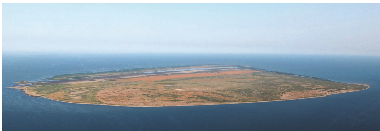
Рис. 1. Остров Тюлений (вид с самолета, июль 2015 г).

наземной биоты, в том числе и фауны гнездящихся птиц, на острове Тюлений началось примерно 200 лет назад.