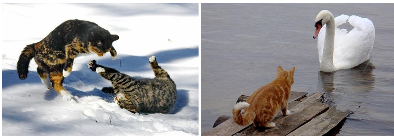
Рис. 4. Слева – игра кошек (дочь нападает на мать). Справа – добыча желанна, но «не по зубам».