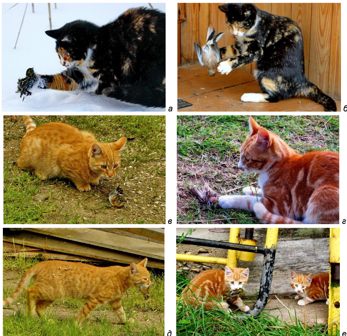
Рис. 5. Тренировка охотничьих навыков у кошек путём игры с добытыми птицами.

кошки не убивают сразу добытых ими птиц, а некоторое время играют, то отпуская их на короткое расстояние, то схватывая снова. Оглушённых или раненых птиц кошки приносят для тренировки и своим котят (рис. 5). Интересно, что так поступают не только кошки, имеющие собственных котят, но и кошки, проживающие с ними одной «семьёй».