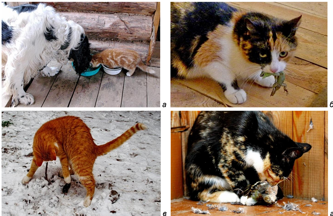
Рис. 1. Различные виды корма домашних кошек в Себежском Поозерье. а – домашняя еда; б – рептилии (самец прыткой ящерицы); в – мышевидные грызуны (полёвка); г – воробьиные птицы (молодой самец зяблика). Деревня Илово-2, 2007-2013 годы.

и возвращаются домой только осенью (сильно одичавшие, но отнюдь не худые). Более того, до деградации отечественного животноводства в период перестройки некоторые из таких бродяг и вовсе регулярно пополняли число «бесхозных» кошек, зимовавших в общественных хозяйственных постройках или в помещениях для содержания крупного рогатого скота, питаясь в основном за счёт охоты.