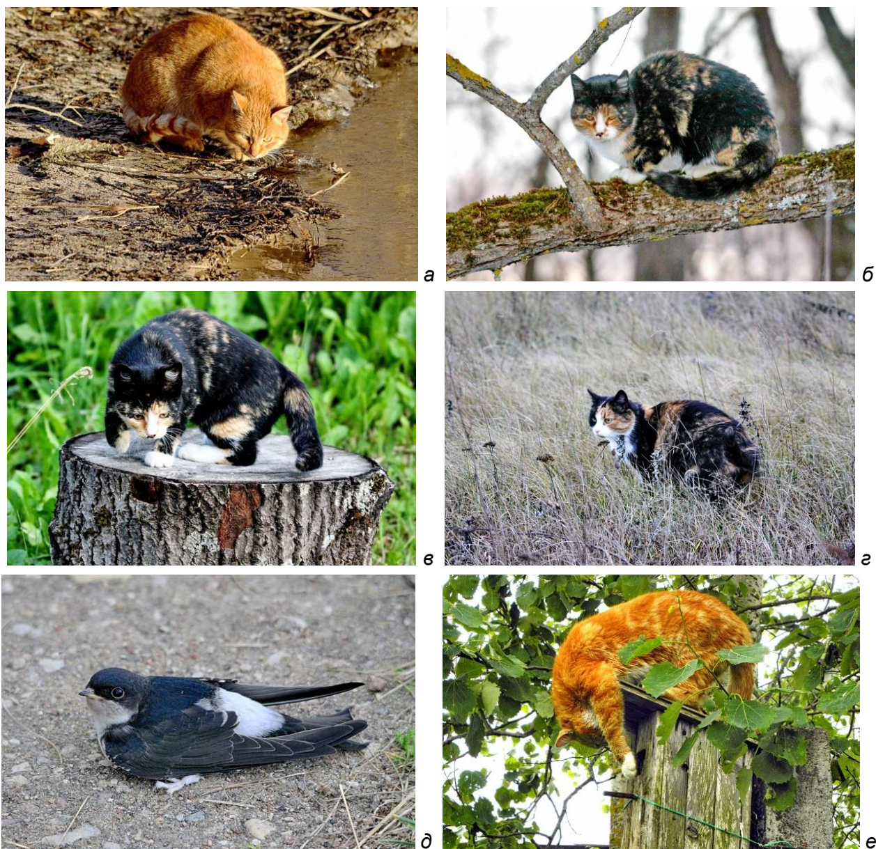
Рис. 3. Разные приёмы охоты кошек на птиц.

В Себежском Поозерье кошки имеют очень хорошие возможности для повседневной и повсеместной охоты на самых разных птиц, обитающих как в антропогенном ландшафте (в населённых пунктах, на приусадебных участках и полях), так и в смежных с ним ландшафтах: на опушках леса, на пойменных и суходольных лугах, на побережьях водоёмов. При этом кошки чаще всего добывают тех птиц, которых могут подкараулить, иногда подолгу неподвижно сидя в засаде на земле, а также над землёй, например в ветвях деревьев (рис. 3а-в), выжидая необходимого момента для верного нападения.