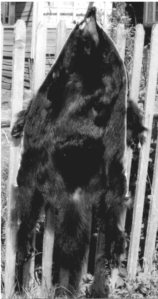
Рис. 1. Шкура росомахи, добытой в Ивановской области.

вана (рис.1). Снятая трубкой и высушенная мездрой наружу вместе с хвостом она имела длину 117 см. В целом окраска густого и длинного меха темная, когти на лапах белые. Шлея узкая, слабо выделяющаяся на общем фоне. В области лопаток передние концы светлой шлеи не сходятся. По огузку шлея заходила за основание хвоста. Судя по типу окраски меха, добытая особь относилась к форме европейская росомаха - G. g. gulo Linnaeus, 1758 (Новиков, 1993).